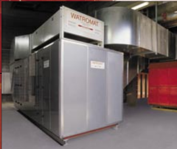
WATROMAT® 6000 droge lucht generator met slibcontainer 30 m 3 (verdampingscapaciteit 6000 kg water/dag)