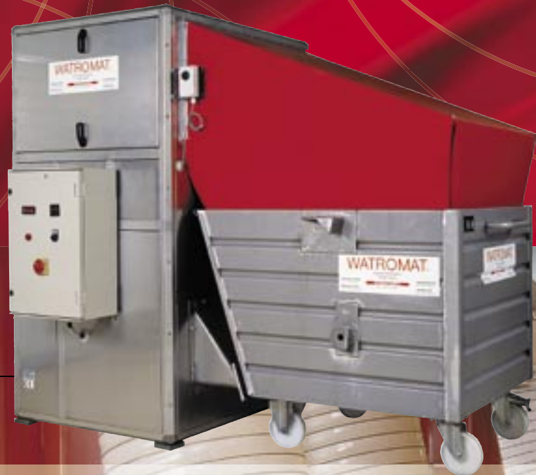
WATROMAT® 200 droge lucht generator met slibcontainer. (verdampingscapaciteit 200 kg water/dag)